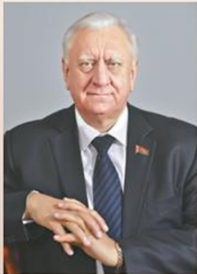
М. В. Мясникович