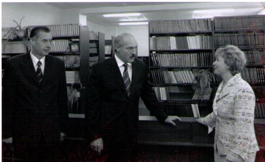
Библиотеку БарГУ посетил Президент Беларуси А.Г. Лукашенко

остаётся больше времени для делового и творческого общения с читателями. По сути, Лилия Вацлавовна со своим коллективом создали библиотеку высшего учебного заведения XXI века.